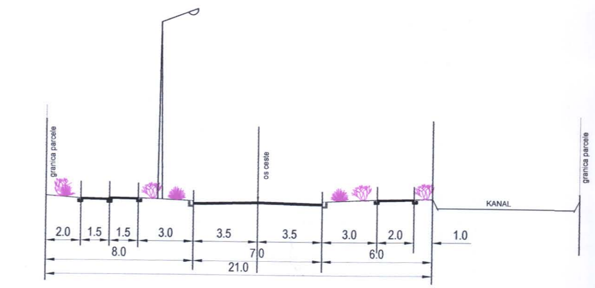
KARAKTERISTIČAN POPREČNI PRESJEK B - B M 1:200